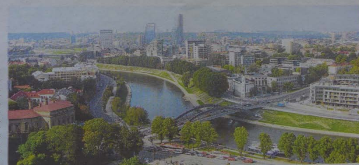
La ciudad de Vilnius, capital de Lituania, centro de operaciones de Rusbaltika

Rusbaltika, una empresa española, trata de facilitar esta aventura: la lle-